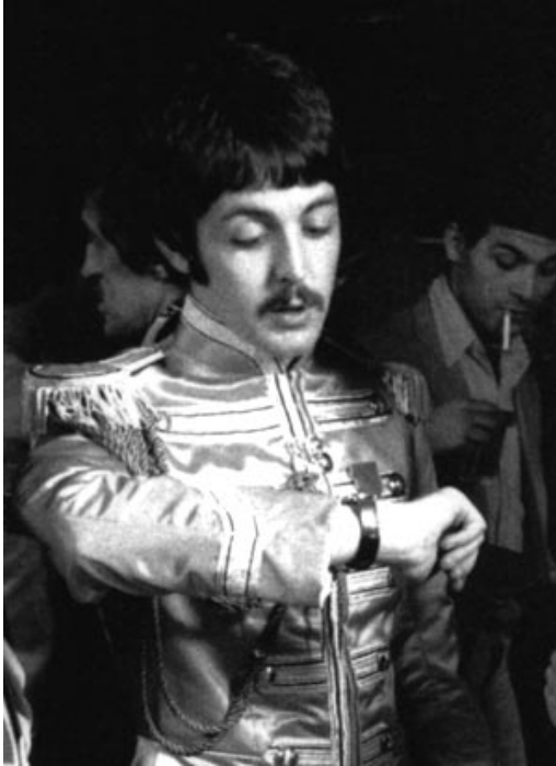
Les montres HOB0 : un temps d'avance.

hobo (pop.) durant la grande dépression des années 30, désignait les vagabonds et les sans abris. - toute ressemblance avec Rolling Stone étant évidemment fortuite, involontaire et carrément pas fait exprès si vous voulez mon avis ou mon poing dans la gueule, au choix (un seul choix par personne)