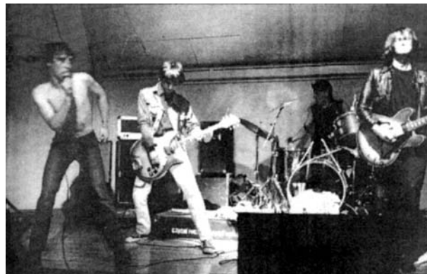
Cherokees circa '88

et apparemment d'autant plus pérennes que le pire était depuis longtemps derrière eux : tout d'abord ces trois ou quatre premiers albums, surprenants sur le champ mais dépassés sitôt que sortis par la meute des punks britanniques; plus tard, les tentatives de recentrage hardcore du milieu des années 80. Finalement, rien de trop catastrophique, d'autant qu'à chaque fois ces errements ont été suivis d'une magistrale mise au point: It's alive - ne serait-ce que pour les photos de Bob Gruen sur la pochette. - et Acid Eaters - que des reprises, sereinement exécutées et toutes de bon goût.