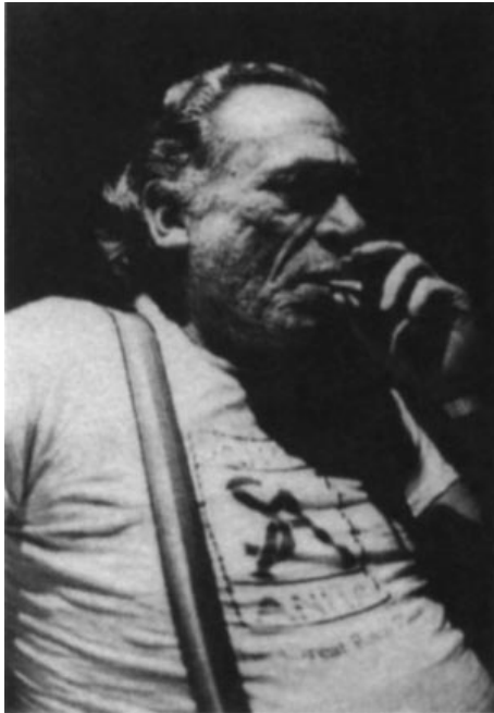
Les bretelles HOB0 : souplesse, maintien et élégance.

« Birth is always painful. And just when you feel you've finished passing the equivalent of basketball through any particular orifice, the process tends to repeat. Such is the nature of a magazine. »